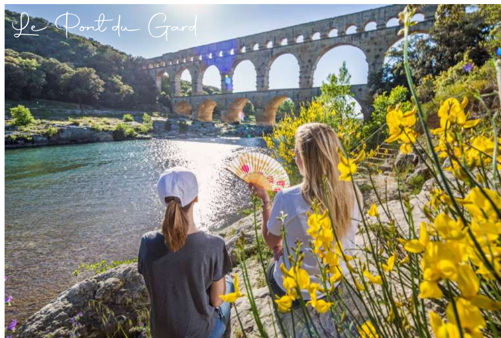
Le Pont du Gard