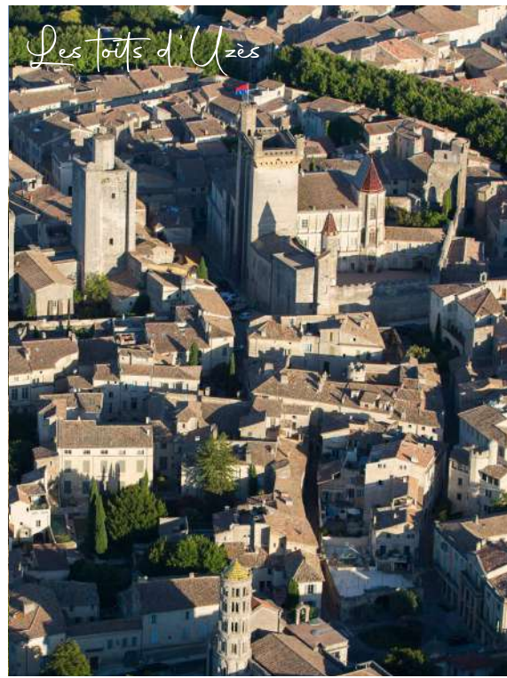
Les toits d'Uzès