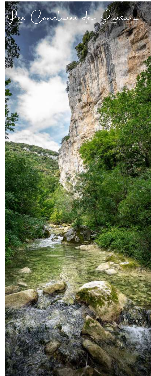
Les Concluses de Lussan